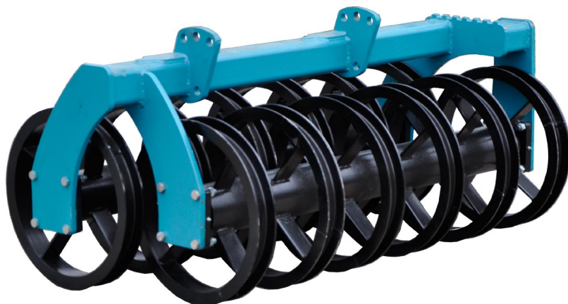
Тяжелый тандемный каток