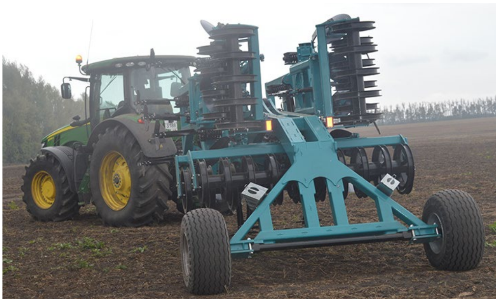
Рабочий орган культиватора с комплектом MulchMix